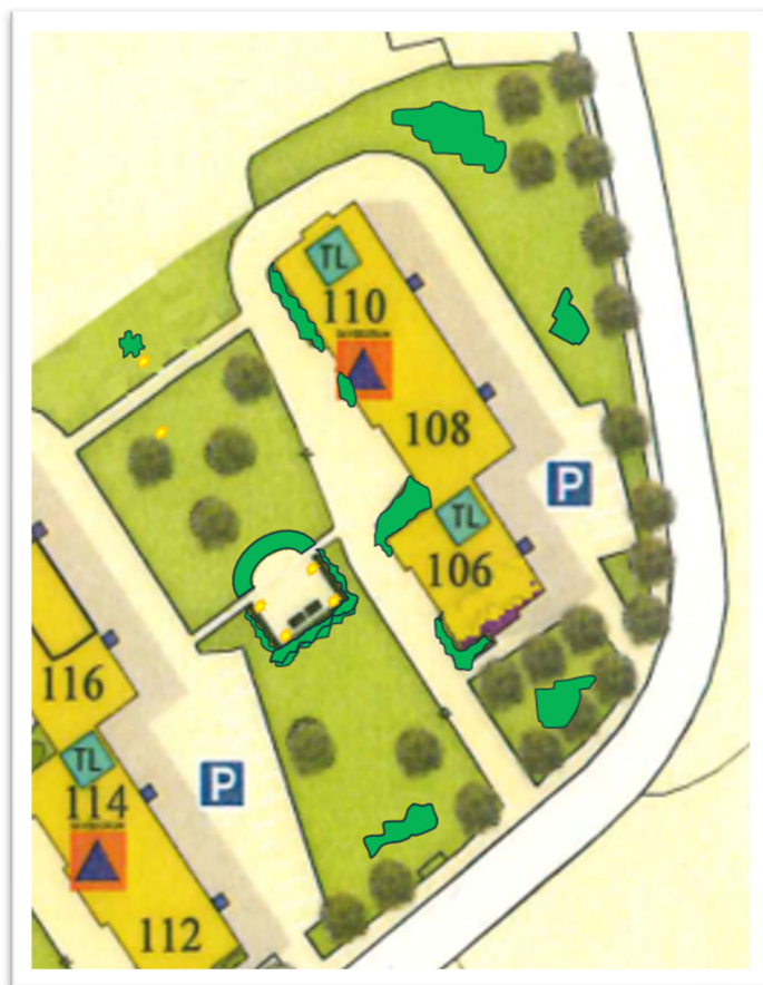
Förslag på träd-/buskplanteringar, rabatter och belysning m.m. på Ringvägen 106-110.

Vid ca 20.00 bör grillning osv. avslutas, för grannarnas skull. Och du: Ha koll på om det är eldningsförbud vid långvarig torka.