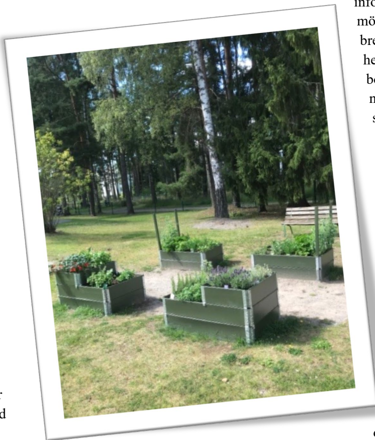
Kryddgrönt och ätbara blommor för alla vid Ringvägen 118. Här är det gott att vara!

information från bl.a. styrelsemötena. Du hittar även våra nyhetsbrev där. Som ett komplement till hemsidan använder vi även Facebook för korta nyhetsnotiser. Så nu finns alla möjligheter att hålla sig väl informerad. Du hittar hemsidan på www.brfringen.se .