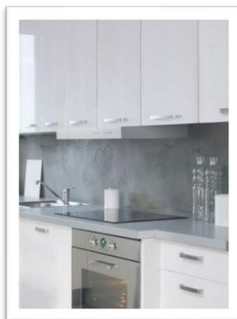
Spiskåpa i vitt