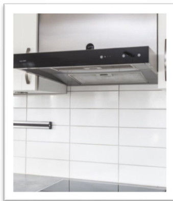
Spiskåpa i rostfritt

Förutom ventilationen kommer styrelsen att upphandla ny markförvaltare för skötseln av våra gårdar, och sedan förhoppningsvis börja rusta upp några av våra grillplatser. I januari-februari ska även våra trapphus renoveras. Det blir målning av väggar, trappräcken och tak, och lagning av trasiga trappsteg. Snyggt och tryggt ska det bli!